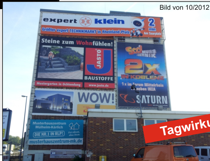
Bild vom 10/2012