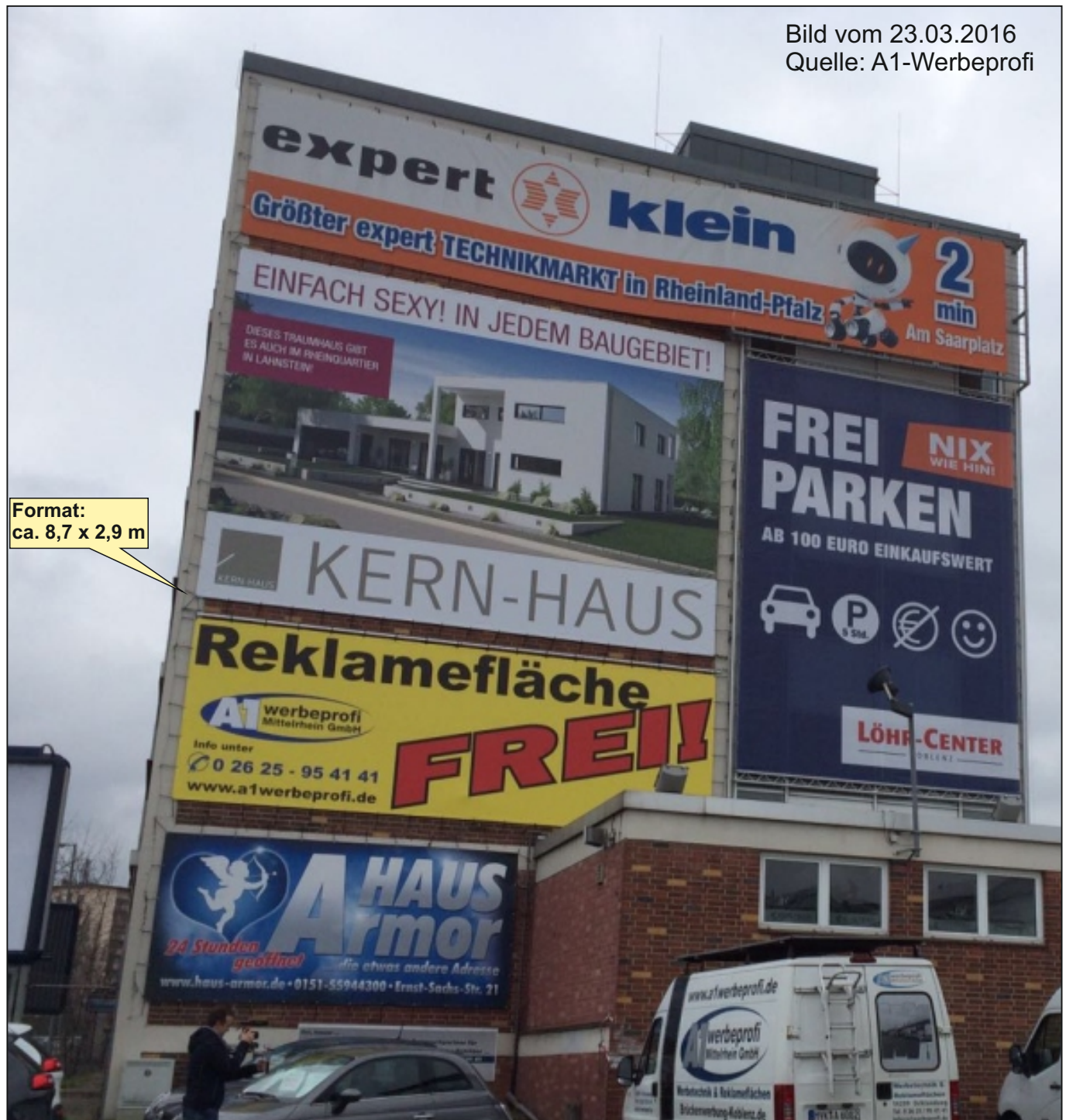
Bild vom 23.03.2016